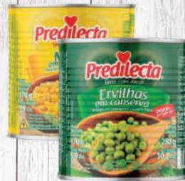
Milho verde ou Ervilha Predilecta lata 170g