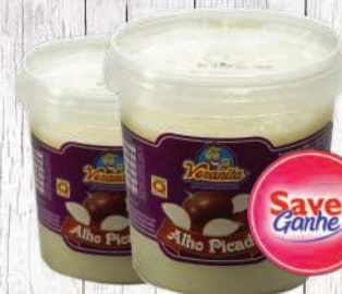
Tempero de alho picado Veranita 400g