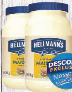
Maionese Hellmann's 500g