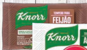
Tempero pronto Knorr 50g

DESCONTO EXCLUSIVO NO NOSSO CARTÃO PAGUE R$ 6,49 Nosso cartão