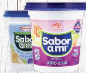
Tempero pronto Sabor Ami 1kg