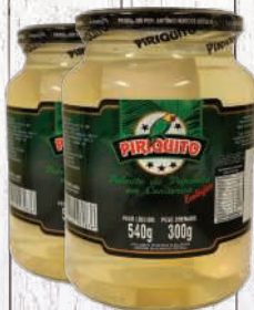
Palmito de pupunha tolete Piriquito 300g