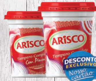
Tempero pronto Arisco pote 300g

DESCONTO EXCLUSIVO NO NOSSO CARTÃO PAGUE R$ 9,90 Nosso cartão