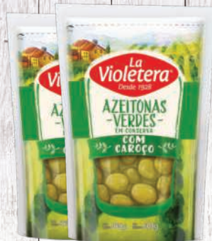
Azeitona verde La Violetera sachê 500g