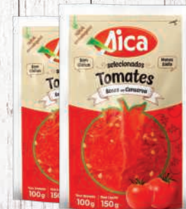
Tomate seco Aica 100g