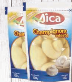
Champignon inteiro Aica 100g